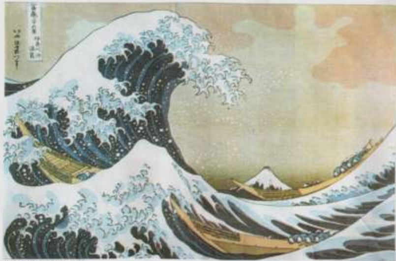
К. Хокусай. Хей